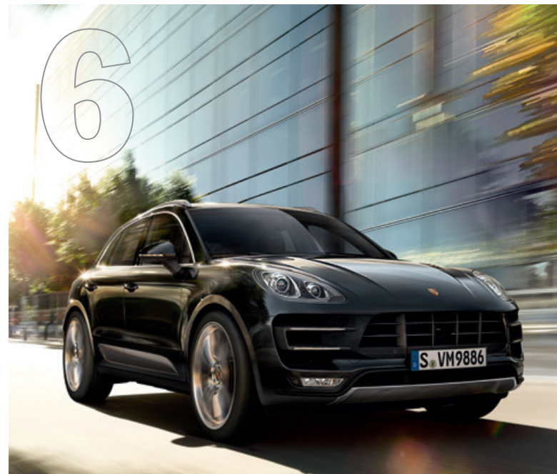
Manchmal ist im Leben keine Zeit für Kompromisse. Der neue Macan Turbo mit Performance Paket.