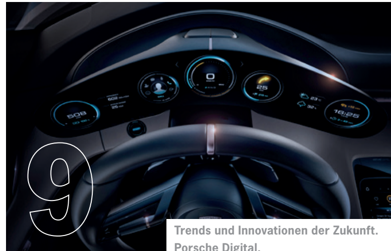
Trends und Innovationen der Zukunft. Porsche Digital.