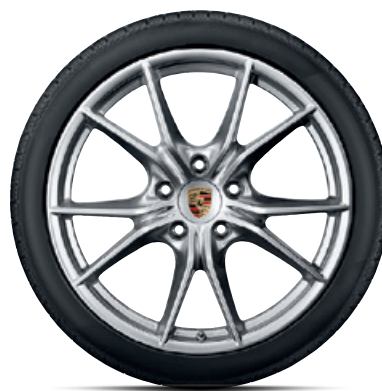
20-Zoll Carrera S Rad

Erhältlich für 718 Boxster und 718 Boxster S sowie 718 Cayman und 718 Cayman S.